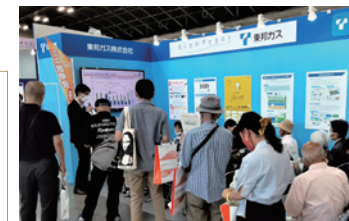
名証IRエキスポ(2022年9月開催)